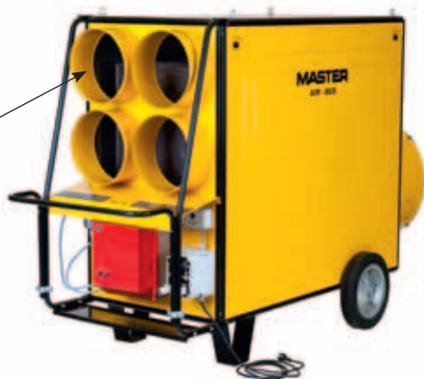
BV 470 BV 690